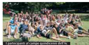
I partecipanti al campo quindicenni dell'Ac

presenti, abbiamo formato una grande comunità, una famiglia. È difficile per chi è a casa crederci, ma le Messe e i momenti di preghiera che all'inizio sembravano faticosi sono diventati il centro delle nostre giornate, arricchite dal contributo e dall'impegno che ciascuno di noi esprimeva attraverso i propri talenti. E questo come è stato possibile? Grazie alla figura di don Emanuele, che è stato presenza importante per tutti e che con semplicità e autenticità ci ha aiutato a fare entrare Gesù nel nostro cuore. Durante la veglia abbiamo fatto rivivere ai ragazzi l'ultima cena di Gesù attraverso il memoriale della cena pasquale ebraica; un momento intenso e di grande curiosità che ha «strvolto» i ragazzi preparandoli al «deserto» del giorno dopo. Un'occasione unica quella del campo per parlare con entusiasmo di Gesù. Abbiamo tutti bisogno di momenti come questi per crescere insieme. I ragazzi imparano ad accettarsi e ad amarsi per come sono, a condividere e a scegliere la strada che li rende felici; per noi educatori è un