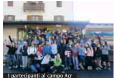
I partecipanti al campo Ac