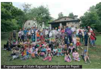
Il «gruppon» di Estate Ragazzi di Castiglione dei Pepoli