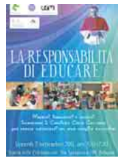
Raffaella Villani, scuola dell'infanzia San Severino