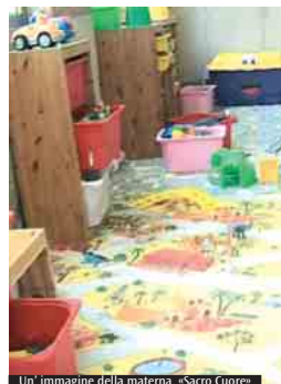
Un'immagine della matema «Sacro Cuore»