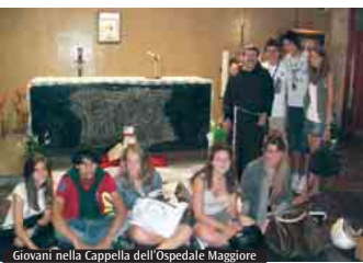
Giovani nella Cappella dell'Ospedale Maggiore