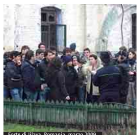
Foro di Jilava, Romania, marzo 2009.