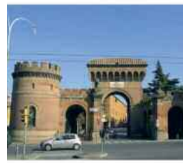
La sede del Museo della B. V. di S. Luca

santuario». Approfondire questa storia e farla conoscere è il compito del Museo, dove si entra gratuitamente, e c'è sempre gratuitamente tutte le sue iniziative. C'è disponibilità per visite guidate per gruppi grandi e anche piccoli, di parrocchie e di altre comunità, «siamo aperti alle scuole - spiega Lanzi - e in particolare siamo in grado di fornire strumenti didattici adeguati ai diversi ordini di scuole, perché, dalle materne alle superiori, abbiamo riscontrato che è possibile capire e conoscere, ciascuno al suo livello, questa vicenda e il suo peso storico, sociale e soprattutto religioso». Il Museo è aperto dal martedì alla domenica, con i seguenti orari: martedì, mercoledì, venerdì, sabato ore 9-13; giovedì ore 9-18; domenica ore 10-18. È chiuso in agosto e, come tutti i musei, il lunedì. (F.G.)