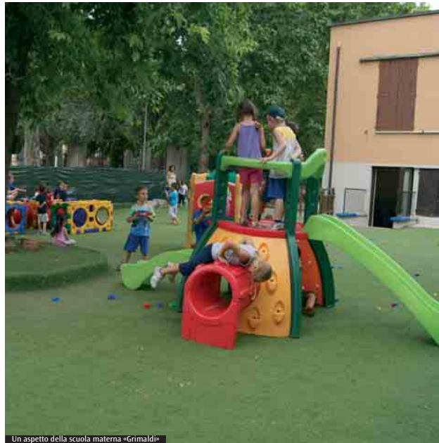
Un aspetto della scuola materna «Grimaldi»

Avete problemi di finanziamento? Disponiamo delle reti dei genitori, dell'aiuto del ministero, e dei fondi della convenzione col Comune di Sasso Marconi. Comunque, cerchiamo sempre di partecipare ai progetti provinciali coordinati dalla Fism, perché i costi di una scuola sono sempre molto alti. Ma se non verranno a mancare, come ci auguriamo, i finanziamenti ministeriali, grossi problemi non ne abbiamo.