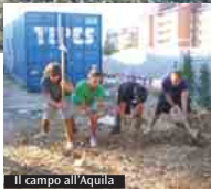
Il campo all'Aquila

Continuiamo la pubblicazione dei contributi dei docenti in vista del convegno del 2 settembre con il cardinale sul tema «La responsabilità di educare».