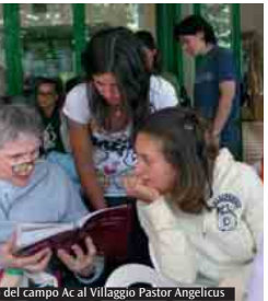
Un momento del campo Ac al Villaggio Pastor Angelicus

coinvolgere, senza risparmiarsi e senza erigere muri di diffidenza, lasciando trapelare una gioventù che è impegnata di voglia di fare e di capire. Ma ciò che rimane maggiormente è la ricchezza delle relazioni che abbiamo stretto. Ogni giorno abbiamo avuto il privilegio di conoscere più da vicino persone e famiglie che, nonostante le difficoltà, continuano a vivere, a sperare e ad amare. Preziosa lezione per noi che viviamo in una società che scaccia morte e dolore come se non facessero parte della vita dell'uomo. Invece, proprio ascoltando chi il dolore lo chiama per