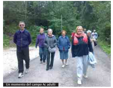
Un momento del campo Ac adulti

Si prepara l'incontro del cardinale Caffara con gli educatori, il 2 settembre. Un profilo della materna nella parrocchia di Vergato, che accoglie 58 bambini