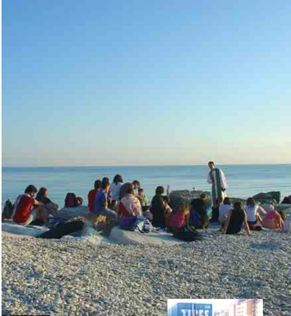
Il campo a Fano