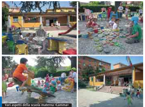
Vari aspetti della scuola materna «Lamma»

Quali le vostre caratteristiche? Noi aderiamo alla Fim, quindi cerchiamo, sotto il profilo metodologico, e anche dei rapporti, di integrarci in questa rete. Un tratto caratteristico della scuola è lo storico legame con il territorio, la scuola della infanzia è stata la prima in assoluto nel Comune di Casalecchio di Reno. Quindi è molto sentita almeno dalla parte più storica del Comune: per essa è un po' un'istituzione. Quali sono i principali problemi che incontra la scuola nella sua attività? I problemi sono quelli di tutte le scuole paritarie: cioè le risorse finanziarie. La nostra non è almeno nella situazione attuale, in situazione di pericolo, ma potrebbe entrarci. Gli ultimi dati sono abbastanza allarmanti, i contributi statali sono drasticamente diminuiti a dispetto dei proclami. Abbiamo una buona convenzione col Comune che scade quest'anno, quindi contiamo di rinnovarla, nonostante le difficoltà degli Enti locali: il rapporto con loro è stato sempre molto buono e speriamo continui ad esserlo. (F.A.)