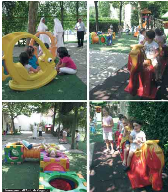
Immagini dall'Asilo di Vergato