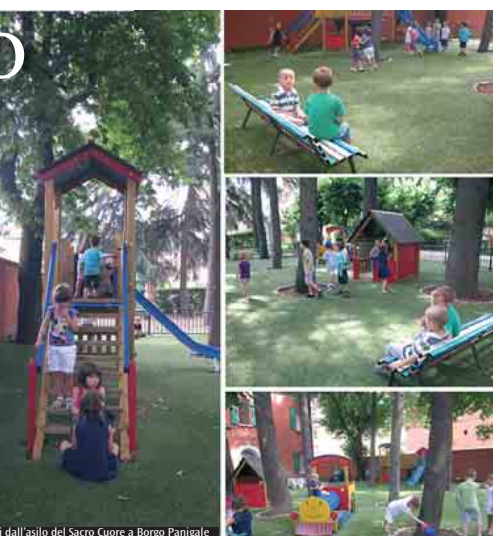
Immagini dall'asilo del Sacro Cuore a Borgo Panigale

16. Al mattino sono prevalentemente collocate le materie di studio. Nel pomeriggio prevalgono le attività di laboratorio. Quali sono i cambiamenti introdotti dall'inizio ad oggi? Nell'ultimo periodo i bambini richiedono una attenzione più personalizzata. Un aspetto molto importante è il tentativo di fare alleanza con le famiglie, un'alleanza educativa tra famiglie e scuola che noi riteniamo necessaria per potere riuscire ad essere il più possibile efficaci. Quali sono oggi i problemi più frequenti? Le risorse ed i finanziamenti. Ci troviamo a dover fare sempre di più avendo in qualche maniera sempre di meno. Ho l'impressione che sfugga sempre il punto nodale, che cioè stiamo facendo un servizio pubblico senza fine di lucro: i bambini che noi abbiamo qui se non fossero da noi sarebbero a carico di chi dovrebbe spendere molto di più rispetto a quello che spende in realtà. Quindi direi che la lotta quotidiana è quella di dover fare tutto bene con sempre meno risorse. Cerchiamo anche di sostenerci con attività collaterali come, ad esempio, una lotteria di Natale, la festa della scuola dove facciamo la pesca di beneficenza; sono tentativi per raccogliere un po' di fondi. Chiediamo un po' di beneficenza alle famiglie che sono certamente sensibili a questo aspetto ci danno anche volentieri un aiuto e questo ci gratifica molto anche perché in qualche maniera sanciscono un patto di fiducia con la scuola.